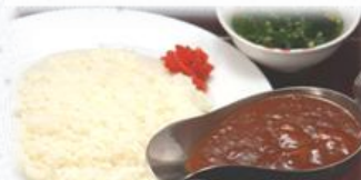
チキンカレー 650円 サラダ。スープ付き