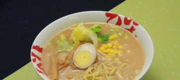
野菜味噌ラーメン 650円