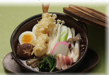
鍋焼きうどん(温) 850円