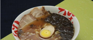
むさし野醤油ラーメン 680円