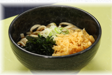
サラダうどん/そば(冷) 630円