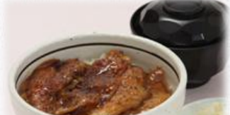
八幡平豚 焼き豚丼 650円 温玉のせ +50円