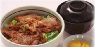
八幡平豚 キムチ丼 650円